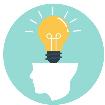
TABLA DE CONCEPTOS